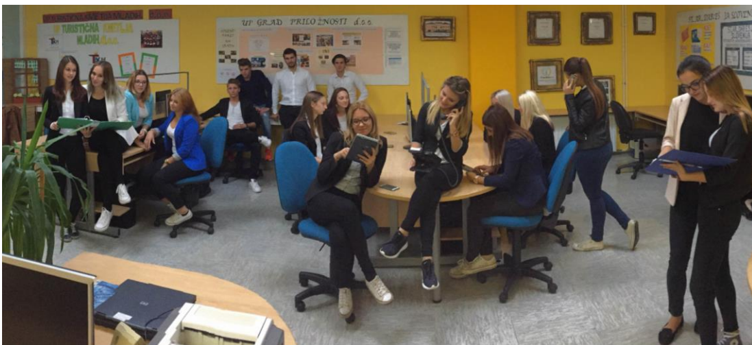
Slika 1: Projektna skupina pri delu

Podatke zapisujemo v tabelah. Za lažji prikaz uporabljamo tudi grafične prikaze, s katerimi prikažemo rezultate morebitnih raziskav.