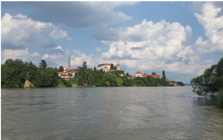
Slika 2 Reka Drava

Drava ponuja mnogo rekreativnih doživetij, saj omogoča ukvarjanje s kopico vodnimi športi in tudi pester ribolov. Ob nabrežjih so urejene sprehajalne in kolesarske poti, ki se vijejo ob znamenitostih mesta. Zanimiva je tudi splavarska učna pot, ki se zaključi na Mariborskem otoku. Posebnost je tudi Drava center, ki ponuja mnoge športne aktivnosti in Krajinski park Drava, ki se nahaja med Mariborom in Ptujem.