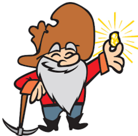
Slika 1 Zlatokop

Zlatokop je oseba, ki išče zlate luske ali nahajališča zlata bodisi pod zemeljskim površjem, v globokih jaških in rudnikih ali na površini v skalah, strugah in potokih. To dejavnost opravlja posameznik sam ali pa usposobljeni delavci rudarskih podjetij s pomočjo različnih preprostih pripomočkov, pa tudi s sodobno tehnologijo.