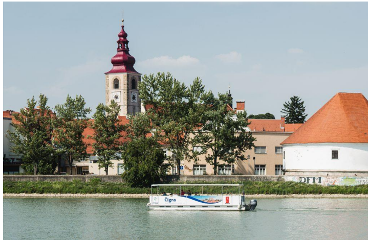
Slika 6 Ladjica Čigra

V okviru turističnega vodenega ogleda na ladjici Čigra se lahko поблиžje spoznamo tako s kulturno, kot tudi z naravno dediščino v neposredni bližini starega mestnega jedra Ptuja. Jezero je izjemno pomemben naravni rezervat, saj na področju jezera in ob njem živi več kot 230 vrst različnih ptic. ( 15 oseb = 8,00 EUR/osebo). Panoramska vožnja traja 60 minut in zagotavlja čudovit razgled na mestno jedro Ptuja in okolico. Ogledamo si lahko Mali grad, Dravski stolp, Ptujski grad, dominikanski samostan in ostale mestne znamenitosti