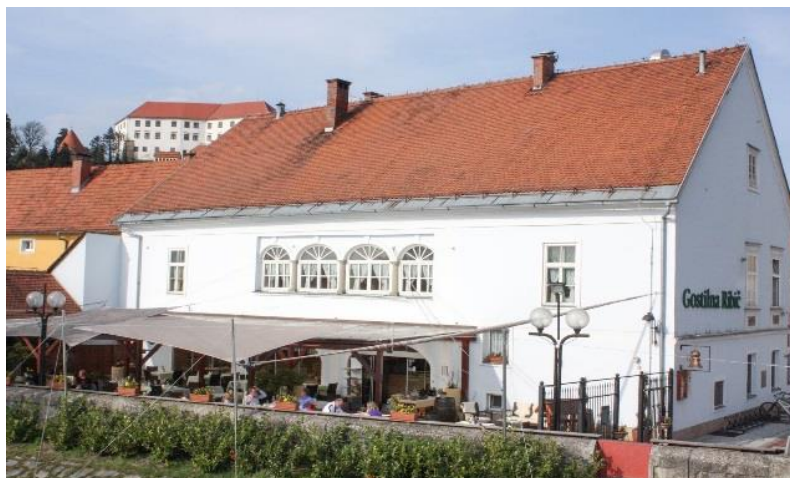
Slika 5 Gostilna Ribič

Restavracija ima na voljo 120 mest za goste v pritličju in prvem nadstropju. V poletnih toplejših mesecih pa je na voljo tudi terasa ob rečnem bregu, kjer lahko gostijo do 90 oseb.