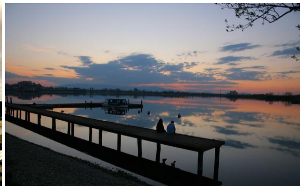
Slika 3 Ranca Ptuj s krasno veduto