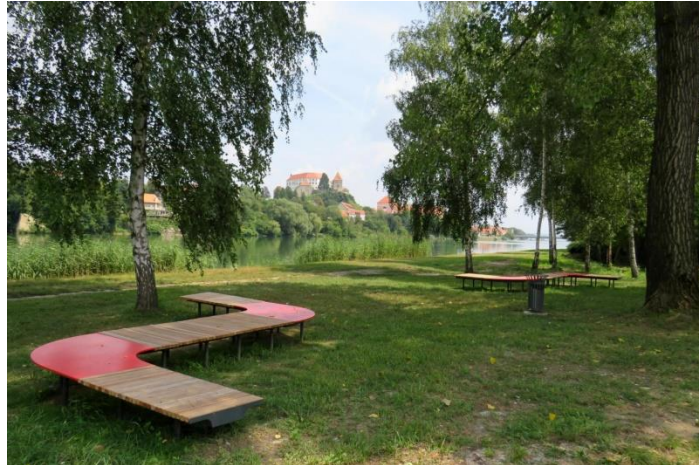
Slika 7 Gozdna plaža