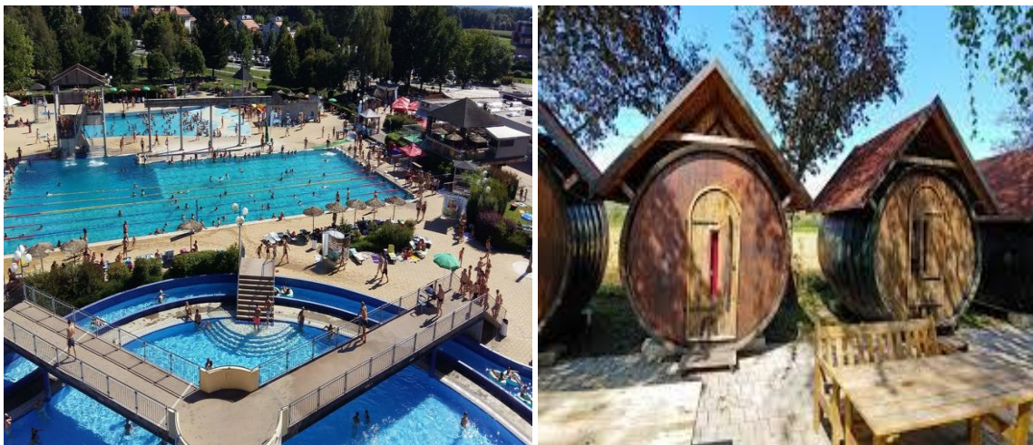
Slika 4 Terme Ptuj in sodi z jacuzzi

Zaobjemite svojo hedonistično plat in se potopite v razkošje ptujskih termalnih vrelecev. Topla naravna termo mineralna voda vas bo v trenutku razbremenila tegob vsakdana ter vam vrnila zdravje in dobro počutje. Že po kratkem kopanju bodo vaše misli bolj harmonične, zaradi izjemne moči vode pa tudi gibanje zelo olajšano.