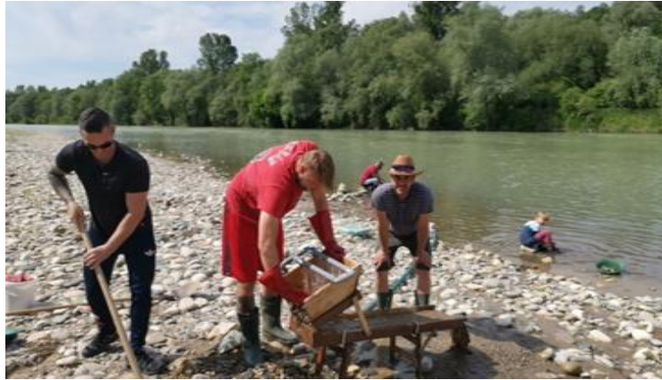
Slika 8 Zlatokopi na Ptujju nekoč in danes