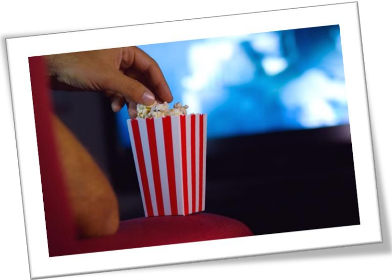
Slika 1: Kino kokice

Takšna preišljena ponudba bi poskrbela za raznovrstno in nepozabno izkušnjo, ki bi pritegnila vse vrste obiskovalcev – od ljubiteljev klasičnih kinoprikazov do tistih, ki cenijo lokalne posebnosti in inovativne ideje.